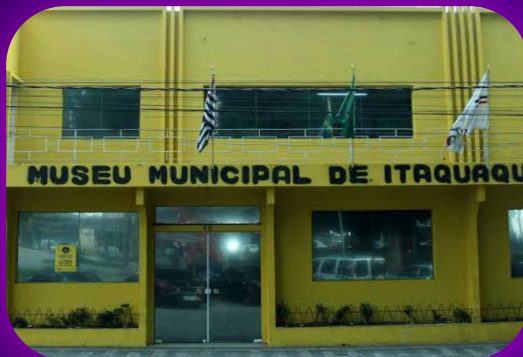
Museu Municipal de Itaquaquecetuba