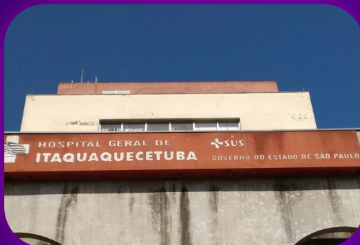
Hospital Santa Marcelina Itaquaquetuba