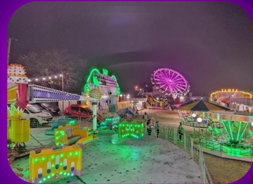
Blue Star center park