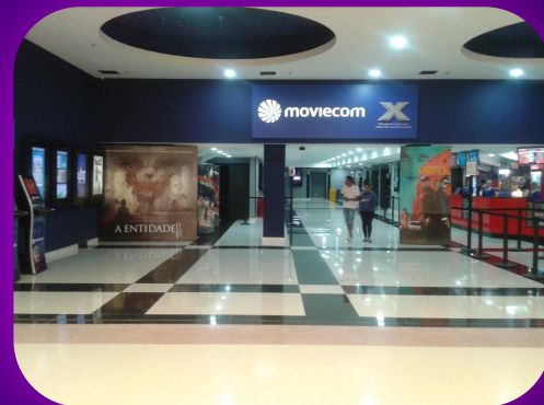
Moviecom X Cinema Páteo Itaquá