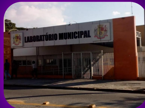
Posto de Saúde